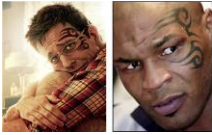
The Hangover Part II – Warner Bros