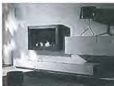
wandmodel bio-ethanol sfeerhaard

2.6. Ruby Décor gebruikt het merk Ruby Fires sinds 2000 voor sfeerhaarden zonder luchtkanaal, waaronder bio- ethanol sfeerhaarden. Zie hieronder twee voorbeeld afbeeldingen.