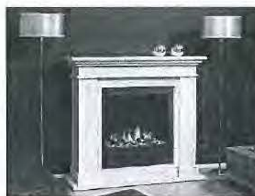
sierschouw met bio-ethanol inzethaard

2.7. Op 14 maart 2008 heeft Ruby Décor het merk RUBY FIRES gedeponeerd in het Benelux merkenregister onder nummer 0842040 voor waren in klassen 6, 11 en 19, waarna het merk op 7 juli 2008 is ingeschreven. Op 20 januari 2014 is hierop een beperking aangebracht, inhoudende dat de waren waarvoor het merk is ingeschreven in klasse 11 slechts ziet op inbouw-, voorzet en vrijhangende (open) haarden; rookkanalen voor schoorstenen; rookkanalen, gasbranders, keramische branders o.a. werkend op bio-ethanol; rookgas- afvoerkanalen; asladen; gasblokken en schijnvuren.