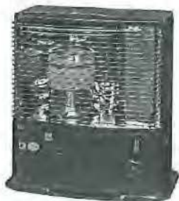
petroleumkachel van Essegé