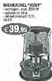
wiekkachel van Essegé