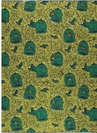
2.5.12. Dessin 14/3739