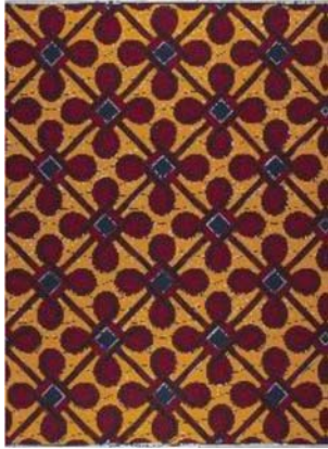
2.5.15. Dessin 14/4971