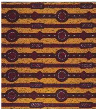
2.5.19. Dessin 2824 R