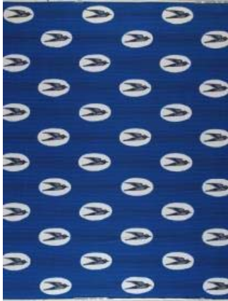
2.5.18. Dessin H 599