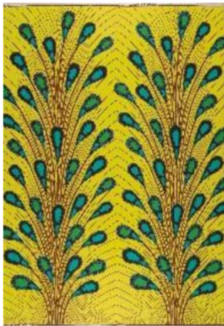
2.5.13. Dessin 14/3826