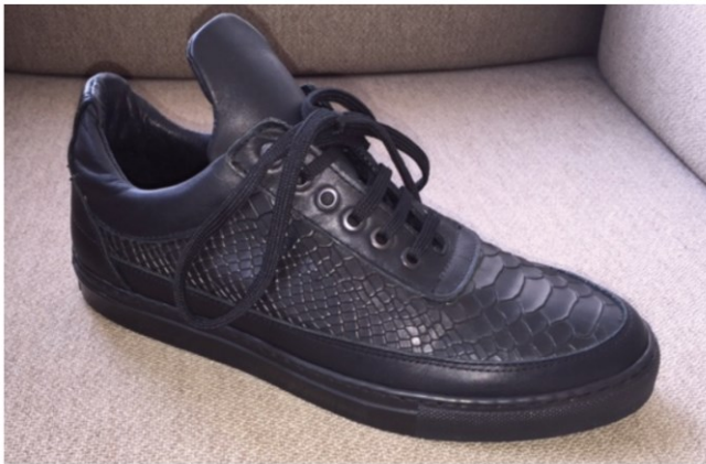
De-Schoenenfabriek - Sneaker Snake

4.19. De 'Sneaker Snake' sneakers verschillen, zoals De Schoenenfabriek terecht heeft aangevoerd, van de 'Low Top Python' sneakers wel in die zin dat het slangenleerpatroon van het bovenwerk anders (gladder) geschud is, dat de in drie vlakken verdeelde hielpartij minder geprononceerd is (omdat die niet – in dezelfde mate – gevuld is) en dat de verlengde schoenlip anders is vormgegeven, in die zin dat die niet over de gehele lengte taps toe loopt in een ronde punt maar ongeveer over de gehele lengte van de verlenging een nagenoeg gelijke breedte behoudt. Deze verschillen zijn naar het voorlopig oordeel van de voorzieningenrechter in het licht van de vele gedetailleerde overeenkomsten evenwel te gering om bij de geïnformeerde gebruiker een andere algemene indruk te wekken dan bij de 'Low Top Python' sneakers. De Schoenenfabriek heeft de van de 'Low Top Python' sneakers afwijkende kleuren van de 'Sneaker Snake' sneakers (naast zwart nog vier andere kleuren) niet aangevoerd als relevant verschil. De voorzieningenrechter neemt daarom met Filling Pieces voorlopig aan dat het enkel wijzigen van de kleur met de 'Sneaker Snake' sneakers het voorgaande niet anders maakt.