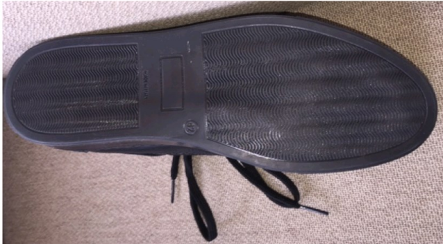
De Schoenenfabriek - Sneaker Snake