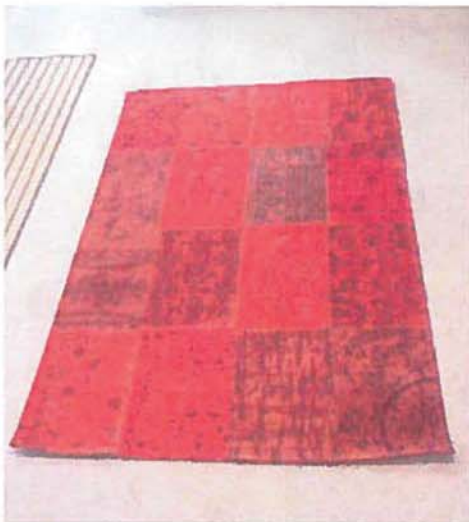
Vintage Multi tapijt

2.20. Door By-Boo is een nieuwe collectie tapijten op de markt gebracht die onder meer wordt aangeboden op de website budgethomestore.nl (hierna: Patchwork-dessin 2). De Poortere heeft een tapijt uit deze collectie aangekocht. Zij heeft daarvan onderstaande foto (rechts) overgelegd, naast een foto (links) van een Vintage Multi tapijt.