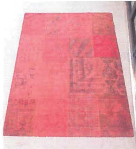
tapijt met Patchwork-dessin 2

2.21. De Poortere heeft via Google gevonden overzichten van patchwork tapijten overgelegd, als hierna weergegeven.