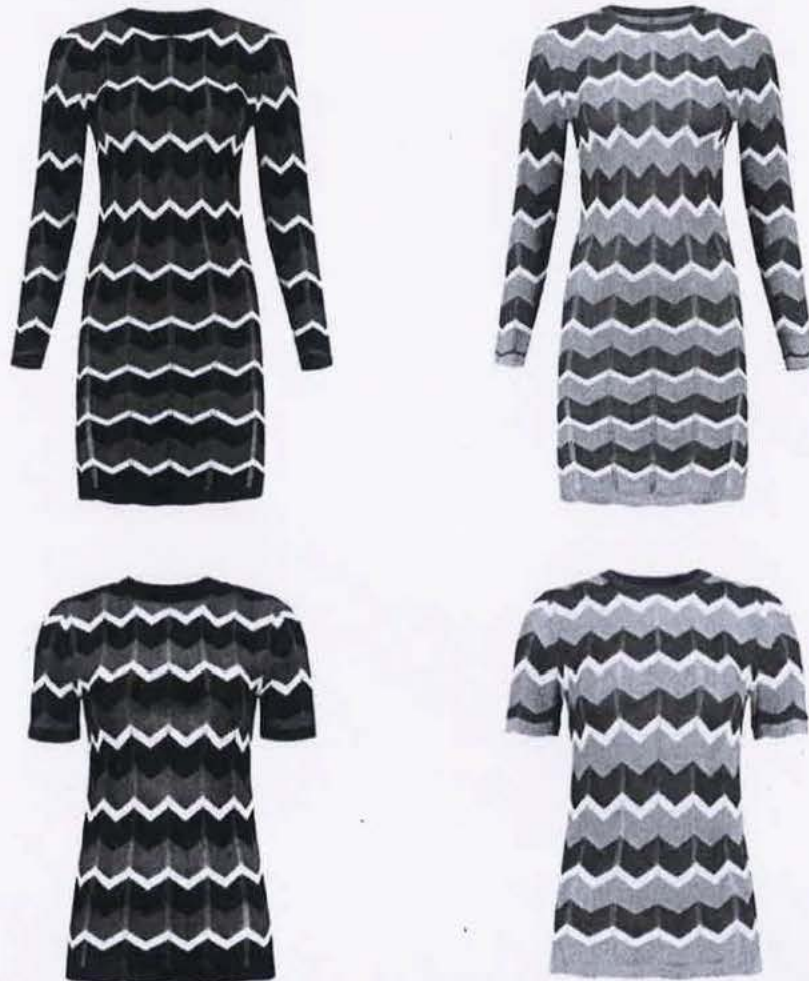
De Nikkie ontwerpen

2.2. NP Fashion heeft de hieronder afgebeelde jurk en top (hierna: de “Nikkie ontwerpen”) geproduceerd en op de markt gebracht. De roodzwarte variant werd vanaf 10 januari 2018 en de grijsblauwe variant vanaf 7 maart 2018 aangeboden aan de consument.