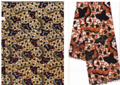
Vlisco (2) [gedaagde] (2)