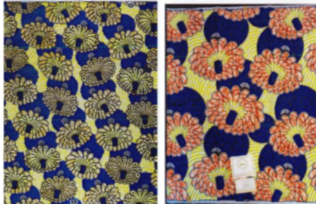
Vlisco (2) [gedaagde] (2)