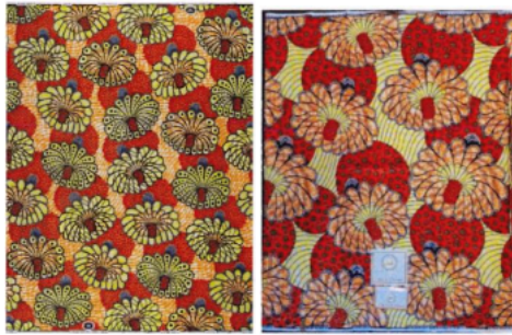
Vlisco (1) [gedaagde] (1)