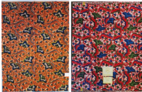
Vlisco (1) [gedaagde] (1)