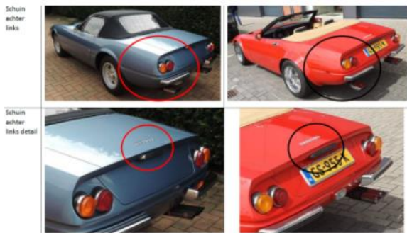
Schijn achter links